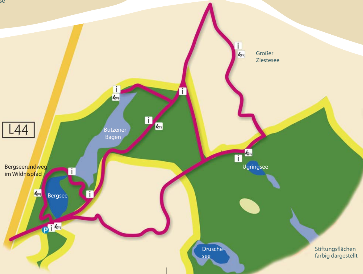
Stiftungsflächen farbig dargestellt

Spendenkonto Mittelbrandenburgische Sparkasse Potsdam IBAN: DE 68 1605 0000 3526 0071 43 SWIFT-BIC: WELADED1PMB